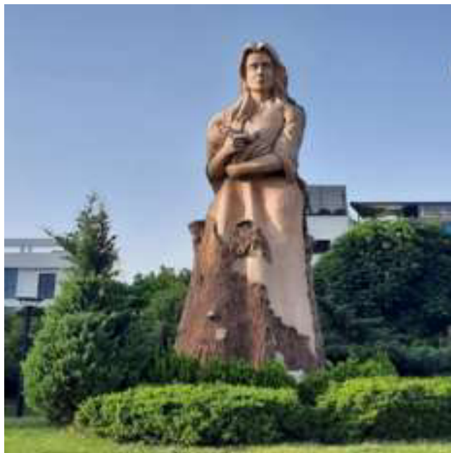
“پەیکەری دایک” لە پارکی دایک لە سلیمانی