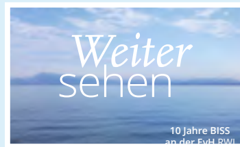
Postkartenreihe zum 10. BISS Geburtstag